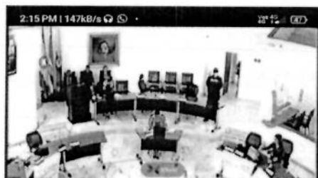
PLENARIA MIXTA PRESENCIAL Y VIRTUAL JUEVES 21 DE ABRIL DEL 2022. Hora: 7:0...